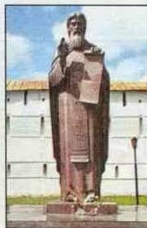
Троице-Сергиева лавра и памятник святому Сергию Радонежскому