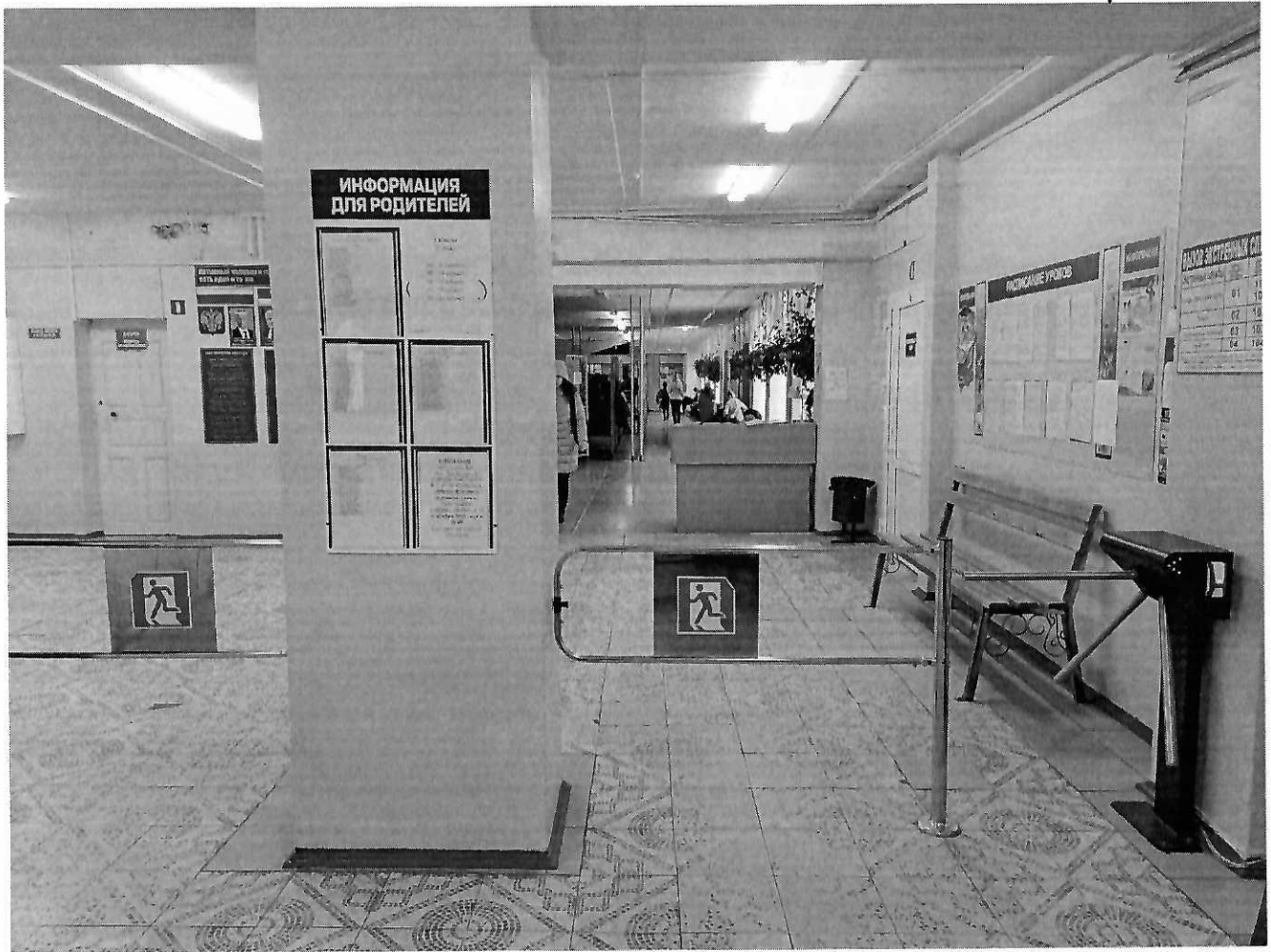
Фото №3. Косметический ремонт внутри помещения.