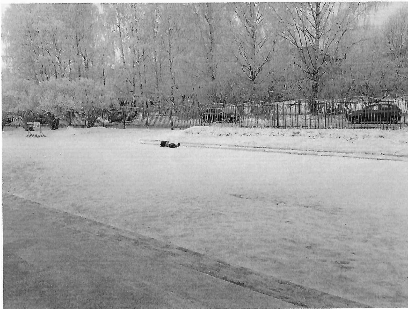
Фото №1. Территория асфальтирование.

Приложение к акту выполненных работ по адаптации объекта и повышению уровня доступности образования для людей с инвалидностью и маломобильным группам населения (МГН) в период с 2018 по 2022 годы к паспорту доступности ОСИ № 88 от 24.07.2018 года